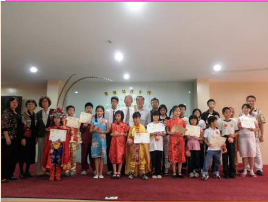
全体表演者与工委会合影

2010年12月19日，配合冬至庆典，本会再次举办「小学生中华文化才艺表演」，提供小学生演出平台。当天参与演出的小朋友呈现的节目有相声，唱歌，华乐演奏，武术，变脸等。精湛的演出，博得全场观众的喝彩。