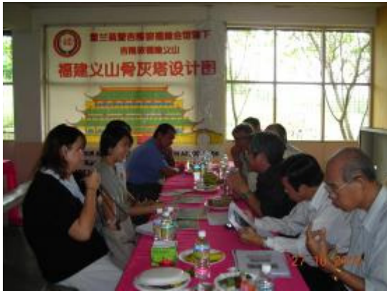
介绍骨灰阁记者会

兴建骨灰阁是福建义山近期的重大工程，是为了应付日益不足的墓地，已在2010年3月获得市政局批准兴建。截至今年4月，是项工程已完成大伯公庙搬迁，临时工地围篱及拆除旧建筑物，内部格位设计与装置的招标，预计两年后竣工，届时将涵盖行政楼，食堂，大伯公庙，供奉灵牌处，并设有地下室停车场和殡仪馆。