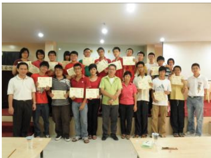
参赛者与筹委会留影