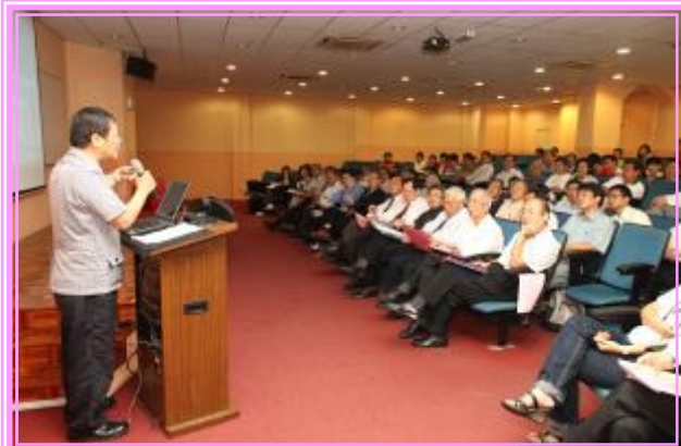
古鸿廷教授风趣的演讲，让台下听者轻松的愉快的增长见闻