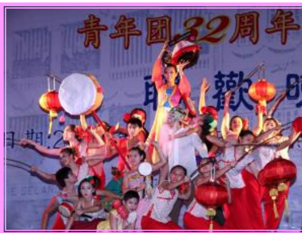
丰年：丰年的喜庆日子里，踩着阿公唱的福建童谣，贺佳节。子子孙孙永铭于心源远流长