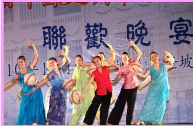
家园美景：优美的马来风光，福建族群与各族群欢欣起舞。庆贺战乱平息，家园重燃生机。