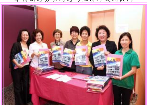
本会娘子军是整场讲座会的招待