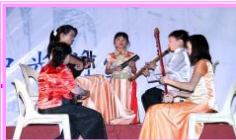
瓜雪暨沙白县福建会馆为本会呈献悦耳动听的南音表演